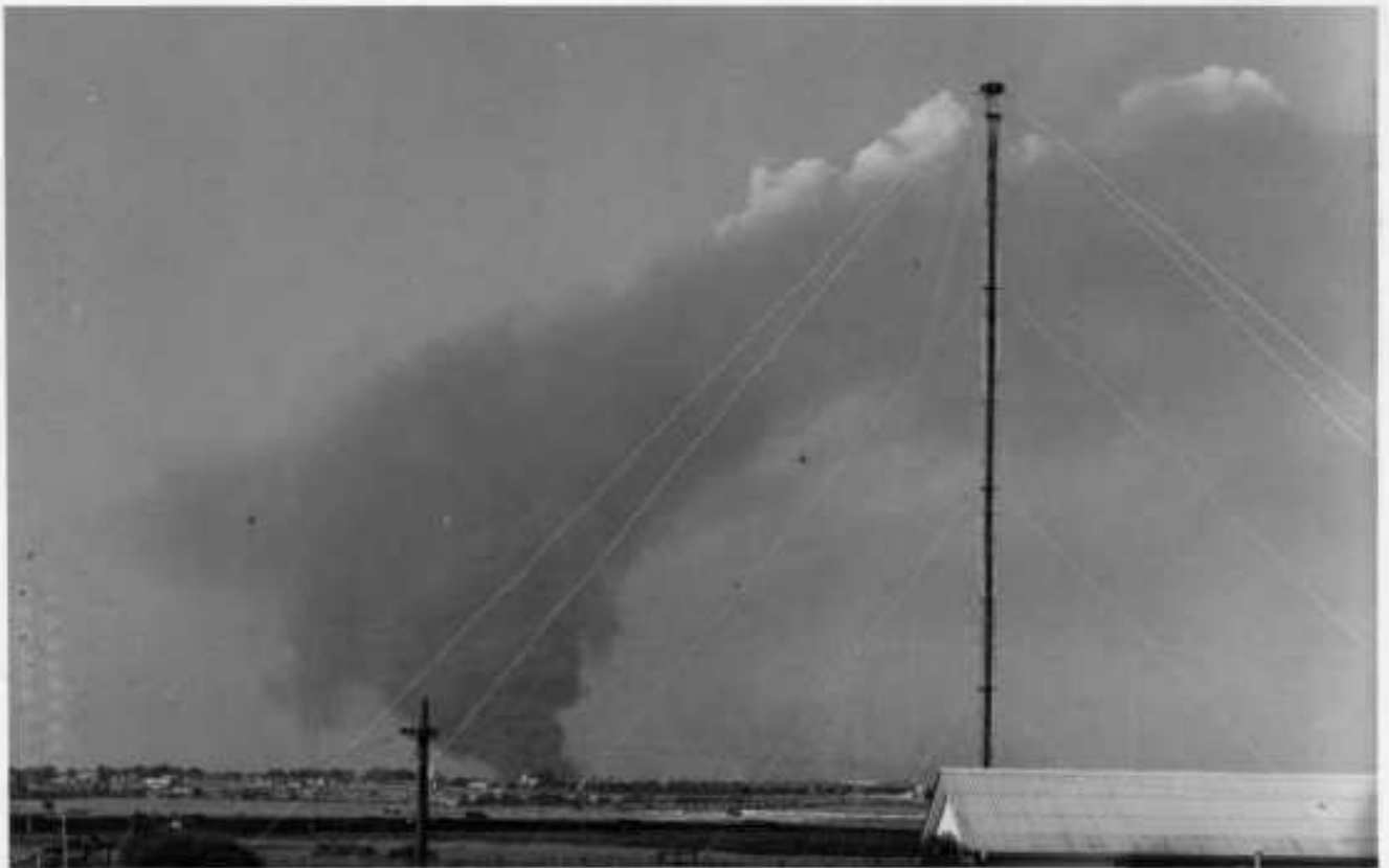
15 Αυγούστου 1974 Η κατάληψη της Αμμοχώστου και της Μόρφου από τον Τουρκικό Στρατό