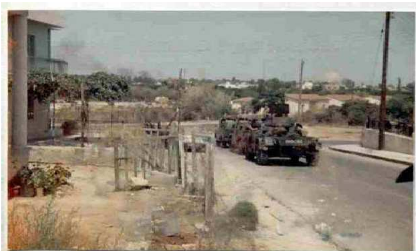
EVACUATING SERVICE FAMILIES